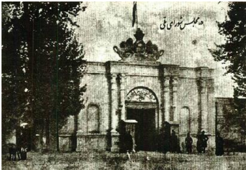
سر در مجلس شورای ملی در دوره قاجار با تابلوی دارالشورای ملی ایران و عدل مظفر در بالای سر آن؛ ۱۳۲۴ق./ ۱۲۸۵ش.

جنگی؛ اجتماع مشروطه‌خواهان در مقابل سفارت انگلیس در تهران؛ تقی‌زاده و عده‌ای از رجال و امرای قشون؛ مجاهدین مشروطه‌خواه رشت؛ اعتصاب بازار تهران در زمان انقلاب مشروطه؛ تجمع گروهی از مشروطه‌خواهان تبریزی در زیر طاق نصرت؛ جمعی از نمایندگان دوره پنجم قانونگذاری مجلس شورای ملی؛ آیت‌الله سیدمحمد طباطبایی و شیخ فضل‌الله نوری در میان جمعی از روحانیون؛ شیخ احمد مجدالاسلام کرمانی، سیاستمدار، روزنامه‌نگار و مورخ دوره مشروطه؛ ۴ نفر مجاهد مسلح مشروطه‌خواه؛ سیدضیاءالدین طباطبایی به‌همراه جمعی از مشروطه‌خواهان در هنگام تصرف مرکز مخابرات؛ میرزا حسن آشتیانی، مستوفی‌الممالک، از سیاستمداران دوره مشروطه؛ باقرخان، سردار ملی، همراه با طرفداران خود در بلوای سال ۱۳۲۶ق.؛ میرزا جهانگیر شیرازی ملقب به صور اسرافیل، از طرفداران مشروطه؛ محمدحسین امین‌الضرب، نماینده تهران در اولین دوره مجلس شورای ملی؛ تصاویر جشن ملی سال دوم مشروطه در جلوخان مجلس شورای ملی (با مشارکت انجمن زرتشتیان ایران)؛ نمایندگان تهران در مجلس اول؛ آیت‌الله سید عبدالله بهبهانی از رهبران مشروطه؛ تصاویری از تحصن‌کنندگان در سفارت انگلیس؛ عین‌الدوله، صدراعظم مظفرالدین‌شاه و از مخالفان مشروطه؛ مشیرالدوله، صدراعظم ایران در زمان امضای فرمان مشروطیت؛ سنگر ستارخان، سردار ملی؛ توپخانه دولتی در بلوای ۱۳۲۶ق. تبریز؛ شجاع‌نظام، از مخالفان مشروطه در کنار سواران خود؛ جمعی از مشروطه‌خواهان در بند اسارت پس از به‌توپ‌بستن مجلس.