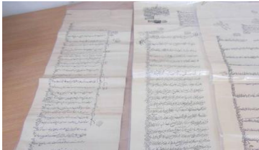
تصاویر برخی طومارهای سندی در زمان تحویل و پیش از مرمت