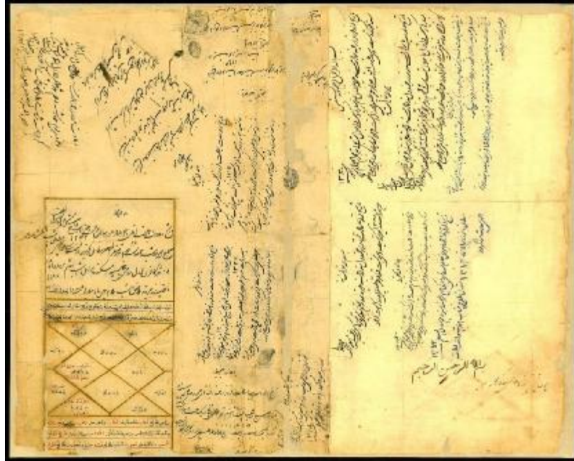
شجره‌نامه فرزندان و نوادگان مهرعلیخان شجاع‌الملک نوری