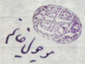
ساکما، ۴۸۹۷۴ / ۲۴۰: شماره ۴۷. وکالتنامه موجول خانم شرافت السلطنه به برادرش صادم الممالک در خصوص حقوق دیوانی خود.