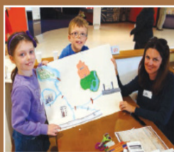
Young helpers planning a 'new' London.

سومین قسمت از مطالب برجسته به «معرفی عکس» می‌پردازد. در این بخش عکس انتخاب شده از نظر مشخصه‌های فیزیکی، اهمیت تاریخی، اجتماعی، سیاسی، فرهنگی و غیره و قدمت، مورد تحلیل قرار می‌گیرد.