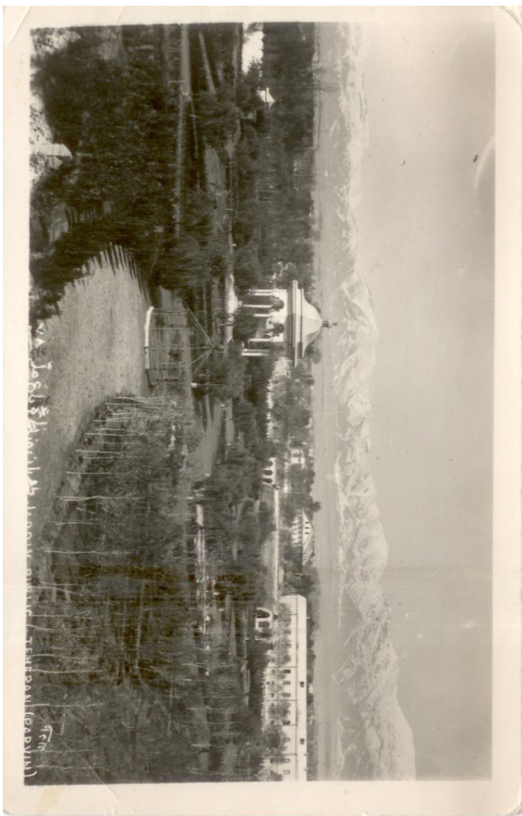
باغ ملی - تهران شماسه سند: ۰۰۵؛ منشأ: آرشیو ملی ایران