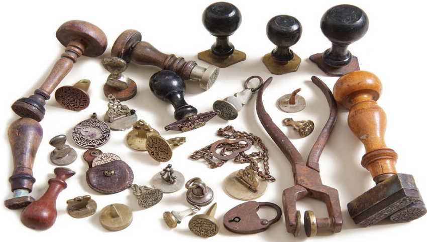
کلکسیون مهر آرشیو قیود قدیمه