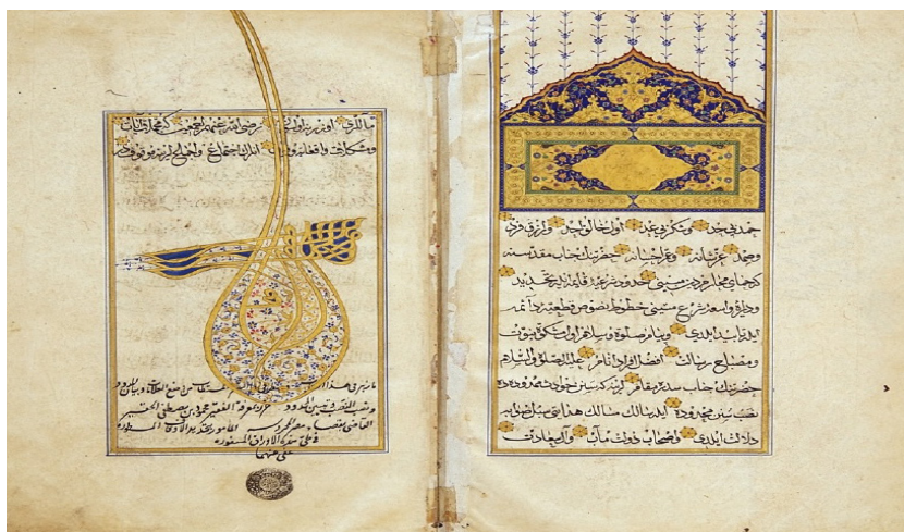
دفتر حدودنامه اوقاف مرحوم سلطان سلیمان

نمایشگاه سوم، متشکل از ۴۸ تصویر سند بود که ۲۴ سند متعلق به اداره کل آرشیوهای دولتی ترکیه و ۲۴ سند نیز متعلق به اداره کل اسناد ثبت اراضی بود. قدیمی‌ترین سند به نمایش درآمده متعلق به سال ۸۰۷ ه.ق.، و متأخرترین سند متعلق به سال ۱۳۲۶ و یک نمونه سند ملکی است. از دیگر موضوعات جالب اسناد، می‌توان به موارد زیر اشاره کرد: