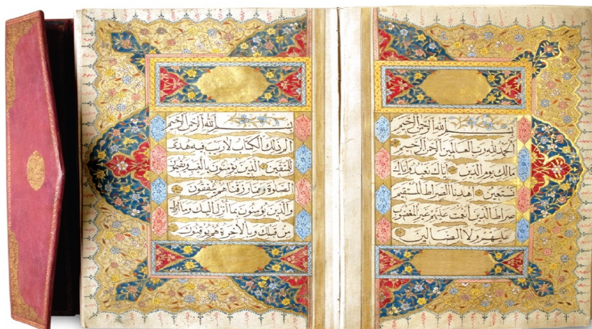
قرآن دست‌نویس و مذهب وقف مسجد خاقانی